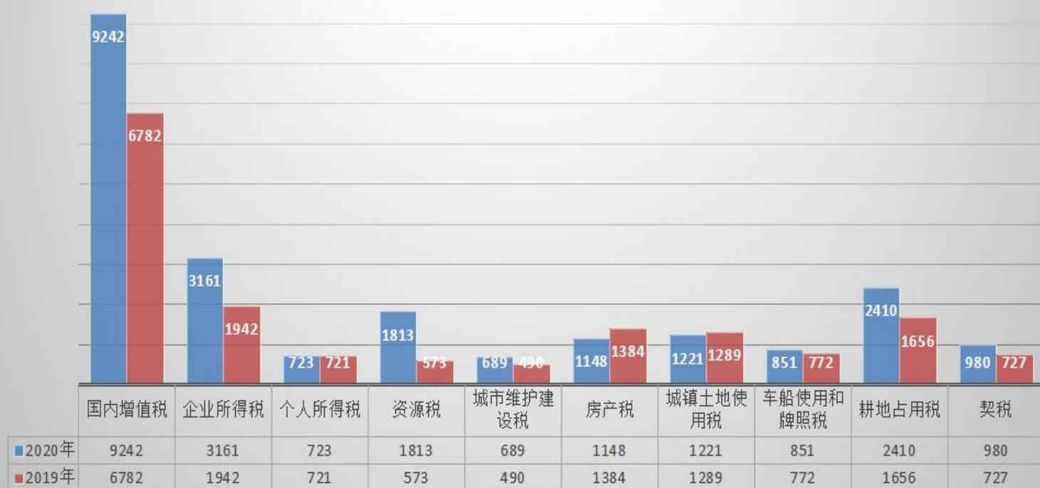
察布查尔县2019、2020年主体税种对比图

(2) 非税收入全年累计完 14173 万元，完成预算的 149.77%，同比下降 8.16%，减收 1260 万元，占公共财政预算收入的 38.35%，其中：